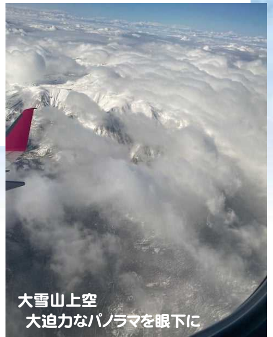
大雪山上空 大迫力なパノラマを眼下に