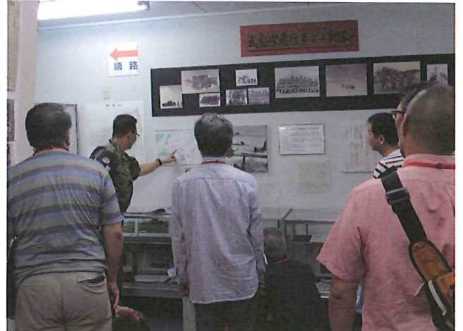
平成26年8月5日(火)国土交通省札幌航空交通管制部 ～航空管制業務について